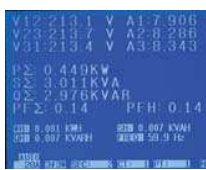
バックライト LCD が数値を表示