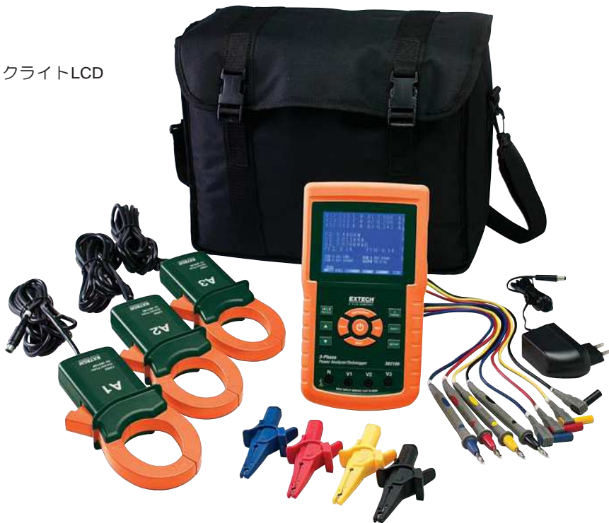
3x電流クランプ、アリゲーター・クリップ付4電圧リード、8x単3バッテリー、SDメモリー・カード、ユニバーサルACアダプター(100~240V)、とケース